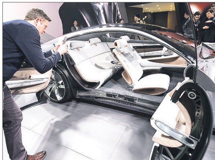
SALON DE L'AUTO. De nombreuses pièces suisses se cachent un peu partout dans les véhicules exposés à Genève.

MACHINES. La croissance du secteur qui tient un salon à Genève sera un moteur des ventes des deux groupes suisses.